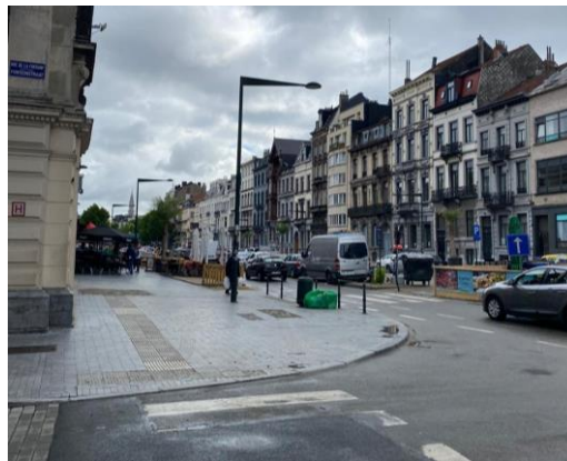
Figura 4 Objetos que invaden las banquetas de manera insensible, a pesar de estar diseñado con criterios inclusivos como lo dicen sus pendientes, dimensiones y guías podotáctiles. (Sierra, 2020)

3.- Finalmente, respecto de la importancia de la promoción, apoyo y sensibilización; resulta evidente, que por más implementaciones que se hagan a nivel físico (como la supresión de banquetas en desnivel, pendientes adecuadas o las guías podotáctiles), mientras no se sensibilice a las personas y se conciba la ciudad como un espacio para la diversidad, seguirán presentándose acciones que evidencian la falta de sensibilidad, como se muestra en la Figura 4, donde a pesar de las adecuaciones físicas, la gente coloca obstáculos, invadiendo un espacio de circulación que por su diseño y amplitud pudiese calificar físicamente como inclusivo. Estudios similares realizados en otras latitudes como Brasil, muestran que esta problemática se reproduce, generando concordancia con lo aquí demostrado, encontrando evidencias de la falta de sensibilización con ajustes razonables mal contruidos (tendido de guías podotáctiles sin eliminación de barreras físicas) y falta de preparación de los técnicos de seguridad que se encargan de verificar el cumplimiento con las normas. (Carvalho de Souza & Duarte de Oliveira Post, 2016)