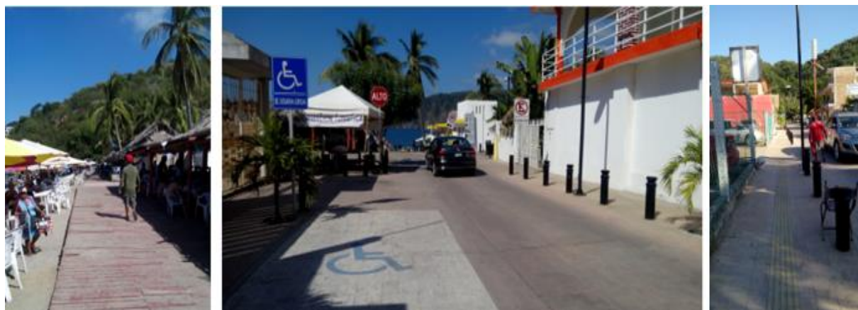
Figura 2 Imágenes de la Playa Cuastecomates, playa inclusiva, cuyas adecuaciones físicas no han logrado que las PcD acudan a ellas: vista del deck colocado en la playa (izquierda) y de accesos a la playa (en medio) y vista de las guías podó táctiles en banquetas. (Solano, 2019)

La nulidad de personas haciendo uso de un espacio accesible, cuestiona sobre la pertinencia de las implementaciones realizadas, y concuerda con los resultados obtenidos, que por encima de las barreras físicas están las actitudinales e institucionales. Ante ello se evidencia la necesaria vinculación de todos los grupos de personas tanto los vulnerados como los no vulnerados en el momento de hacer intervenciones urbanas, con el efecto de generar empatía y cambios actitudinales. Estudios realizados en Varsovia, Polonia han encontrado que la experiencia del usuario (con o sin discapacidad) es una fuente definitiva de información para los diseñadores y planificadores (Piotr Zajac, 2016) y su trabajo demuestra la importancia que tiene el hecho de que todas las actividades relacionadas con la mejora de la accesibilidad sean consultadas con las partes interesadas (población completa) recomendando consultas públicas y acciones planificadas para garantizar la minimización de errores.