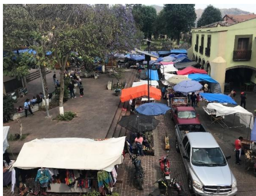
Figura 3 Espacios públicos supremacistas y capacitistas: errores en conjunto de diseño y actitud se hacen evidentes en plazas públicas elevadas, invasión de vehículos y demás obstáculos en áreas de circulación sin consideración ante la contingencia por SARS-CoV-2. (Solano, 2021)

Previo a la pandemia, ya se había registrado un aumento de normas y reglamentaciones como un primer paso para mejorar la accesibilidad e inclusión de todas las personas, como lo muestra un estudio europeo denominado “City accessible for everyone”. (Piotr Zajac, 2016) Este estudio señala que el siguiente paso, tras la generación de las reglamentaciones, es encontrar una manera de implementar dichas regulaciones ajustándolas a especificaciones, condiciones o necesidades locales, situación que se ha complicado con la pandemia, habiendo en algunos casos un retroceso a los avances obtenidos. Estos estudios concuerdan con lo mostrado en las observaciones realizadas, ya que evidencian la distancia que existe entre las normativas y las condiciones o especificaciones particulares de cada lugar, donde estas condiciones van desde lo económico, lo social, lo cultural y lo actitudinal. Con ello se puede inferir que ese es el principal eslabón que se debe resolver: el intersticio entre las normativas y las condiciones multidimensionales que pueden obstaculizar su ejecución, lo que sugiere nuevas posibilidades de investigación.